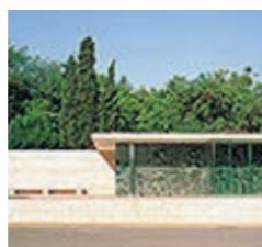
Barcelona Pavillon von *Ludwig Mies van der Rohe