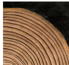
organische Rundung, Baumstamm

Ein Piano, das mit dem Formprinzip der Rundung spielt . Es erscheint natürlich, weich und in sich ruhend. Wie ein Musikstück, das um einen Hauptgedanken kreist: Rondo